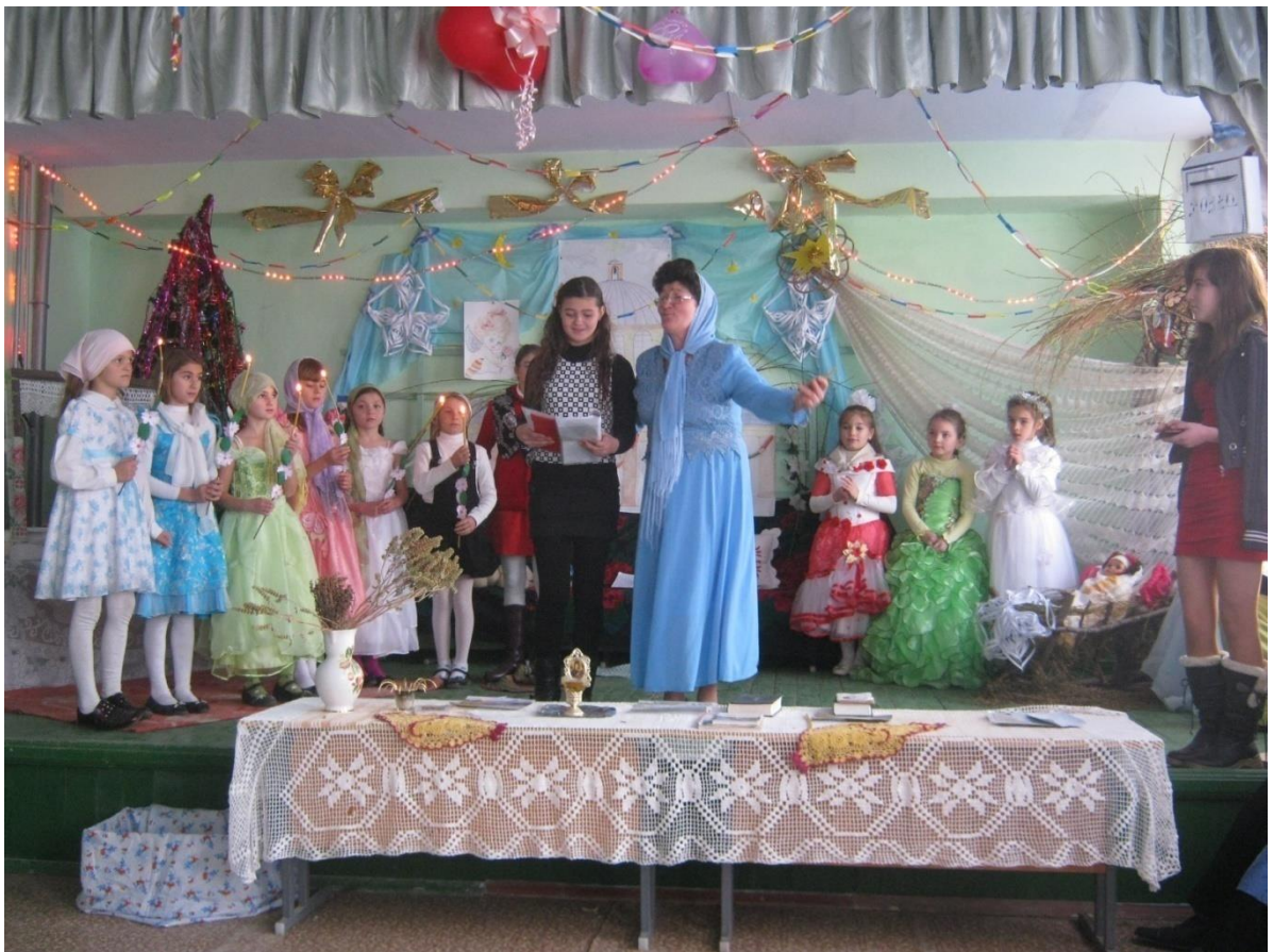
Ora optionala – religia