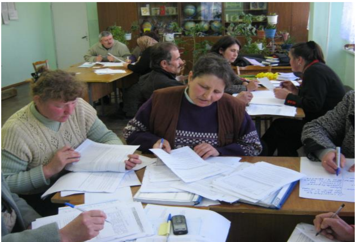
în cadrul seminarelor instructive