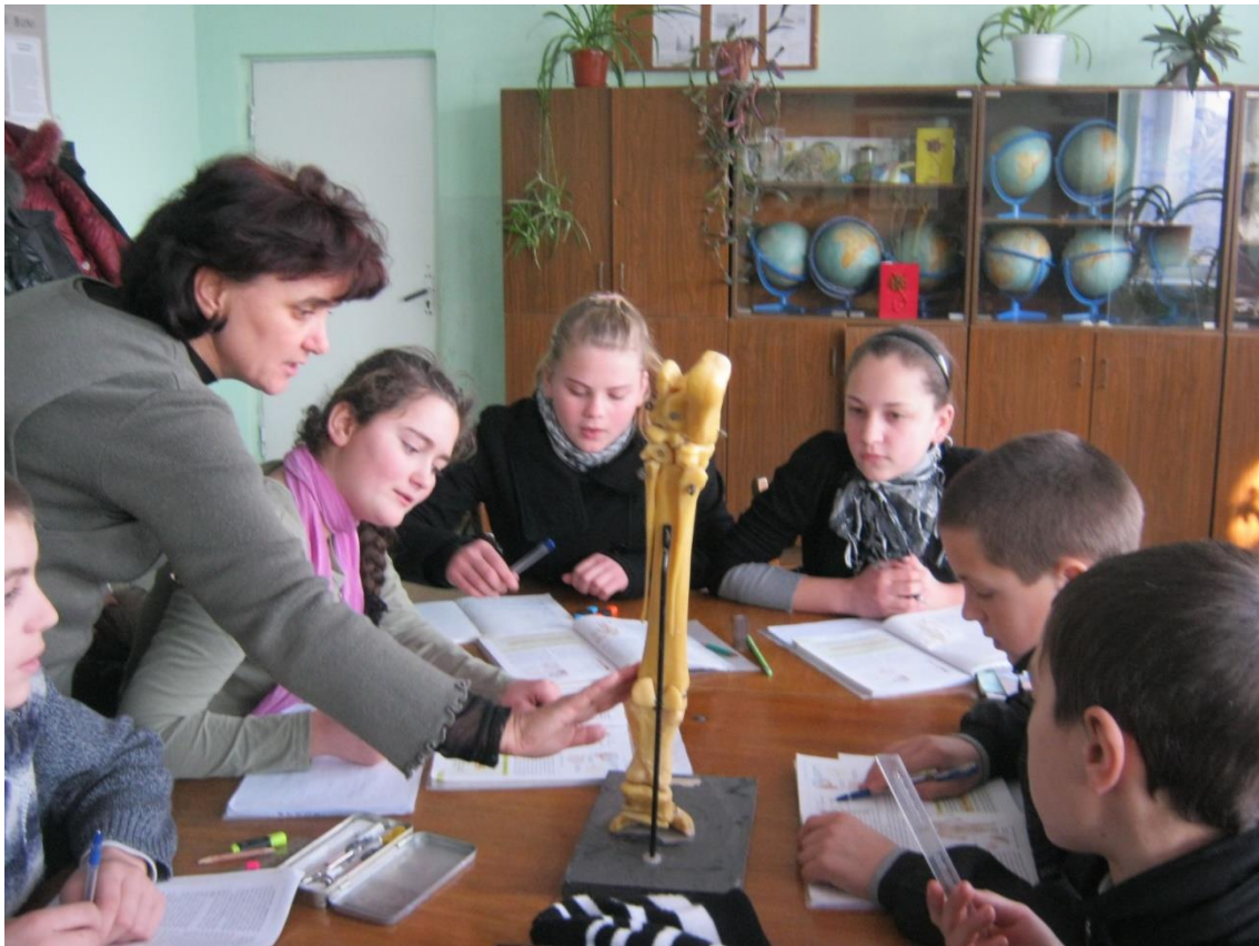
La o lectie de biologie, clasa a VIII