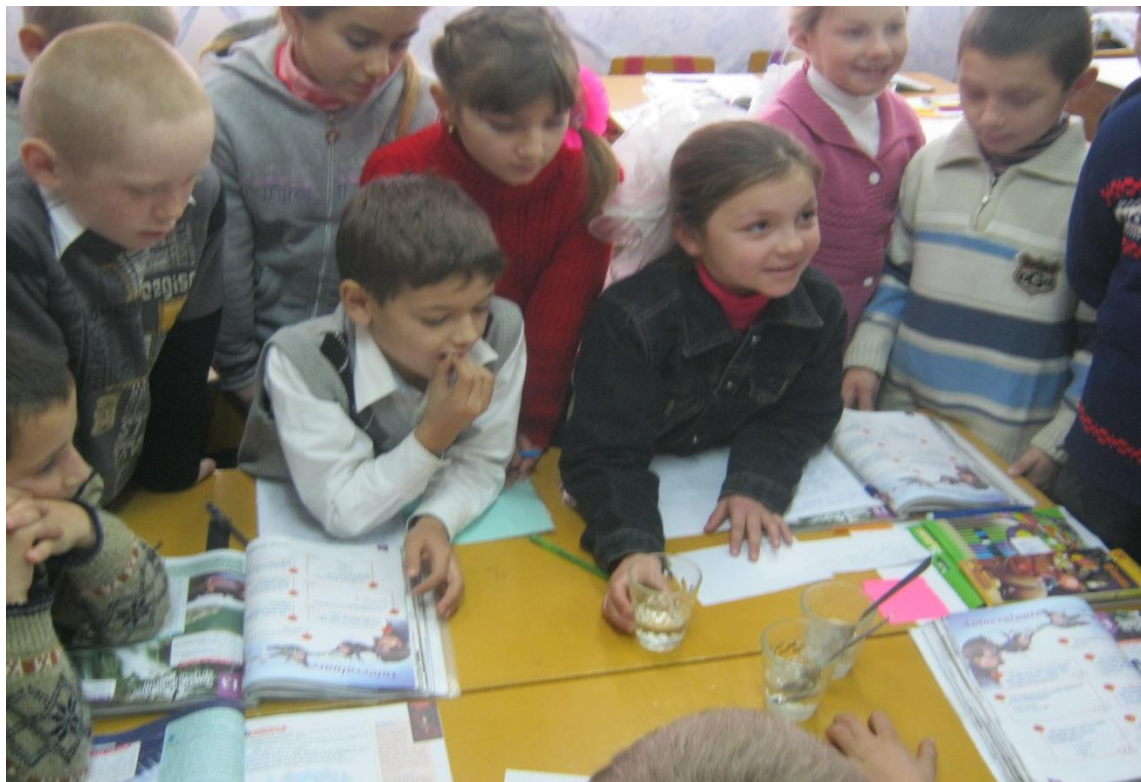
O lectie de stiinte, clasa a III-a