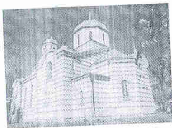
Fig. 2 Biserica Sfânta Cuvioasa Parascheva

Iluminatul stradal de înaltă calitate va contribui la dezvoltarea economică a așezării și a locuitorilor acesteia. Avantajul esențial al satului Nișcani este că satul este onorat să fie înzestrat cu o biserică inedită – Biserica Sfânta Cuvioasa Parascheva este un monument de arhitectură înregistrat în Registrul Monumentelor Republicii Moldova protejate de către stat. În plus, din 2017, orașul Călărași face parte din traseul turistic național, ceea ce poate contribui și la fluxul de turiști în satul Nișcani. Pentru a crește atractivitatea turistică a satului Nișcani și a răspunde solicitării populației locale, s-a decis iluminarea arhitecturală a Bisericii Sfânta Cuvioasa Parascheva.