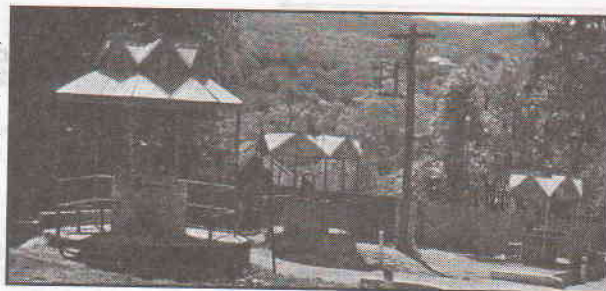
Trei fântini cu apă bună.

Siliștea a fost atestată documetar în anul 1600, pe timpul domniei lui Mihai Viteazul și Ieremia Movilă. La început purta mai multe denumiri – Vovinești, Hovinești, Horginești, ca în cele din urmă să accepte toponimul actual. Vornicul de gloată Toader Birsan, la 5 oct. 1631, a depus la curtea domnească o mărturie hotarnică pentru despărțirea ocinelor satelor Hoginești și Bravicea. Iar voievodul Vasile Lupu, la 12 aug. 1647, întări feciorilor lui Cozma Bînzaru a opta parte din Vovinești cumpărată de la urmașii Șențoaei. În 1653 făcu