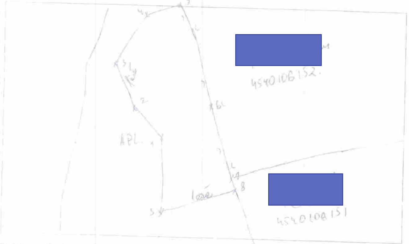
Schema de stabilire a hotarului sectorului de teren

Anexa la Actul de constatare pe teren din 06.11.17.