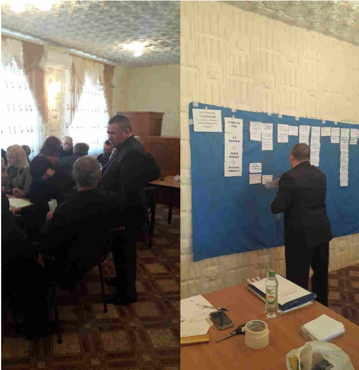
Secvențe de la seminarul de lucru pentru elaborarea planului strategic.