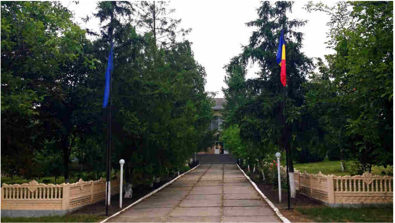
Primăria satului NEGREA, raionul Hîncești.