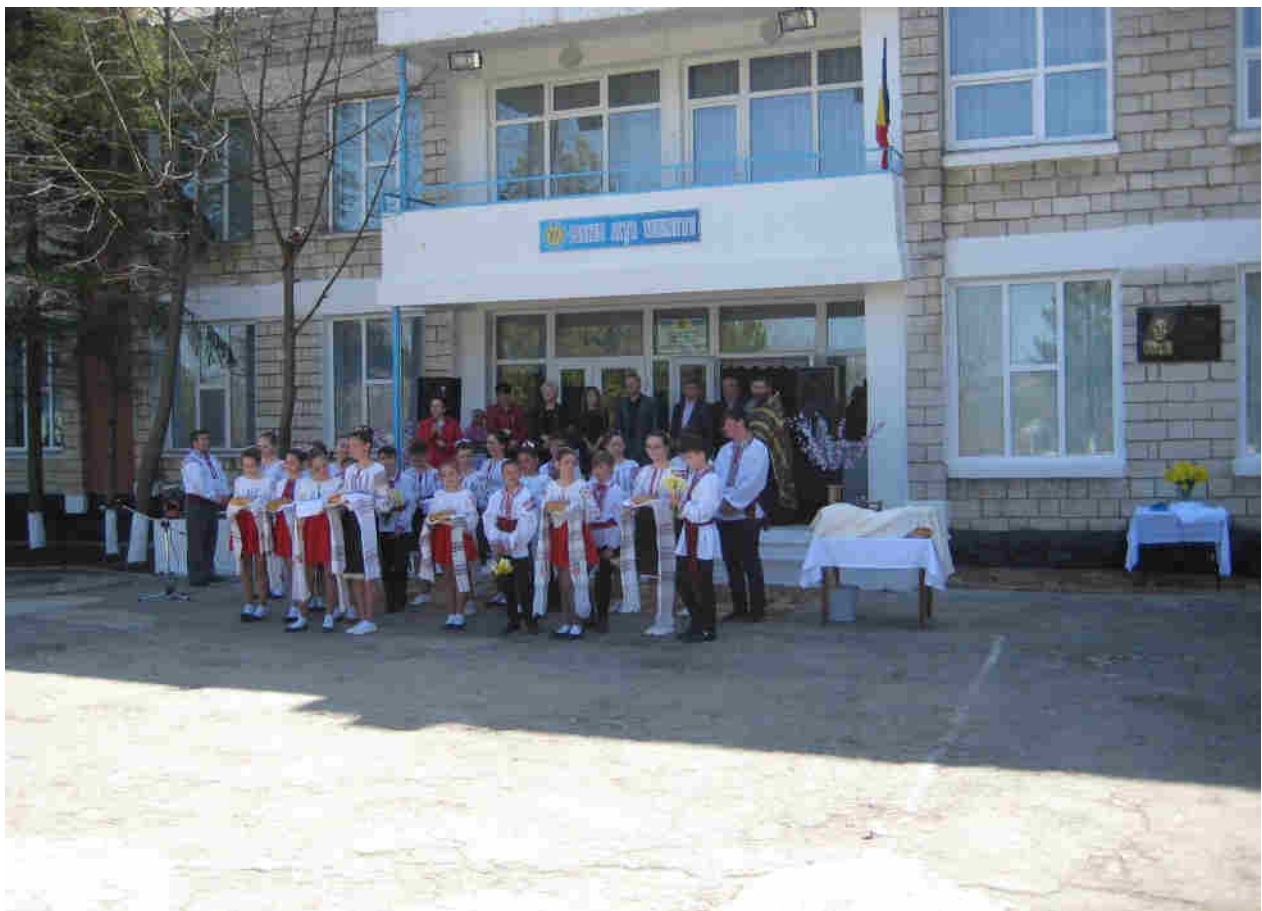
Dezvelirea plăcii comemorative la gimnaziul „Serghei Anisei”.