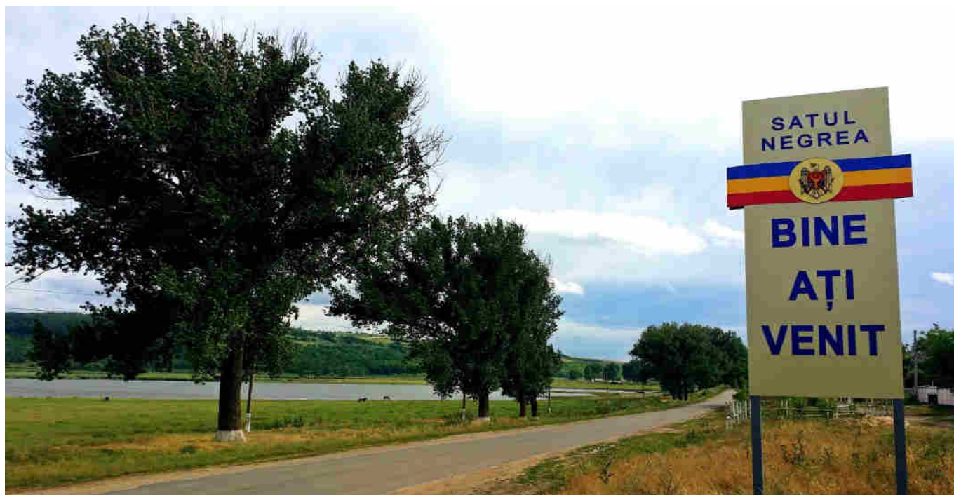
Intrarea în satul NEGREA, raionul Hîncești.