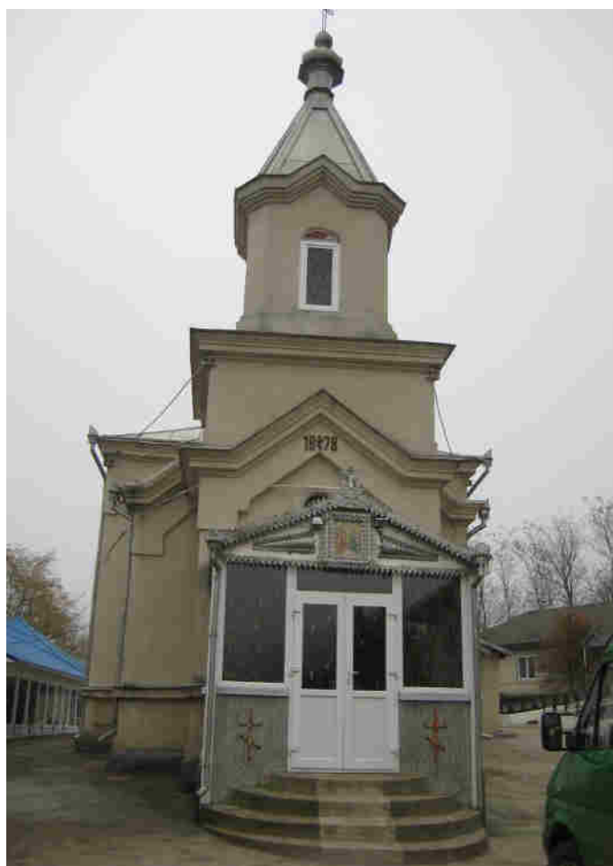
Biserica satului, amplasată pe o stîncă de piatră, supraviețuitoare a celor două mari alunecări de teren. În baza ei a fost construită Mănăstirea Negrea.