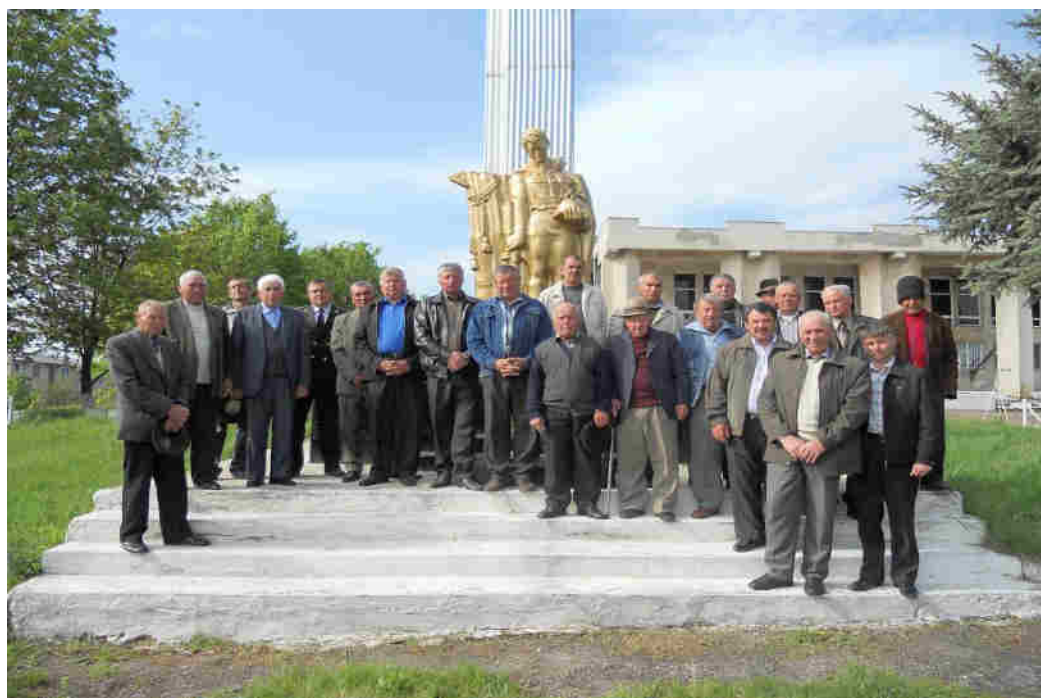
9 Mai, omagierea veteranilor.