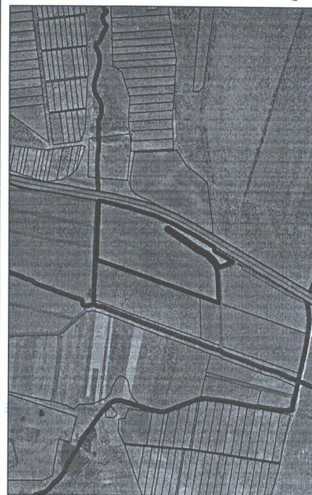
237 - numarul cadastral al terenului