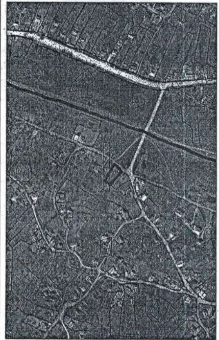
171 - numărul cadastral al terenului