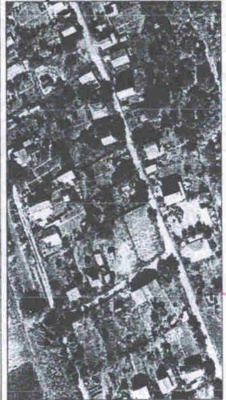
288- numarul cadastral al terenului - numarul postal al cladirii