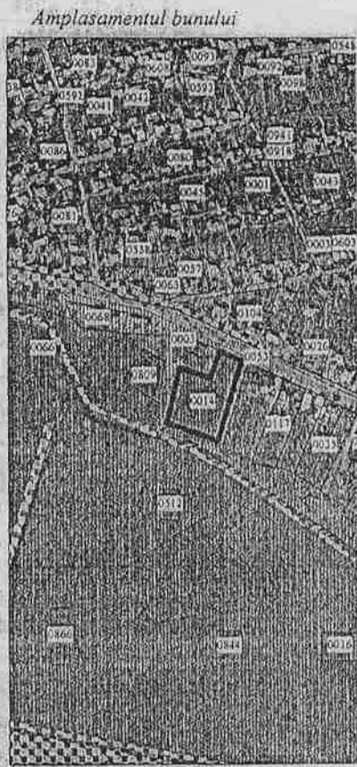
0014 - numărul terenului